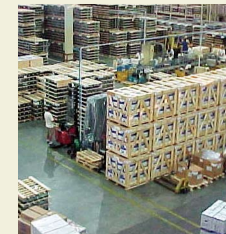
O projeto padronizou a apresentação das amostras de compressores.

Amostra é a palavra utilizada para definir todo produto oferecido aos clientes pela primeira vez. Esta amostra pode ser uma demonstração ou experimentação sobre o produto, o qual facilita a compreensão, sob diversos aspectos.